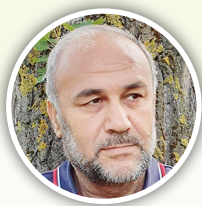
تەنگەزارى مارىنى / ئەلمانىا